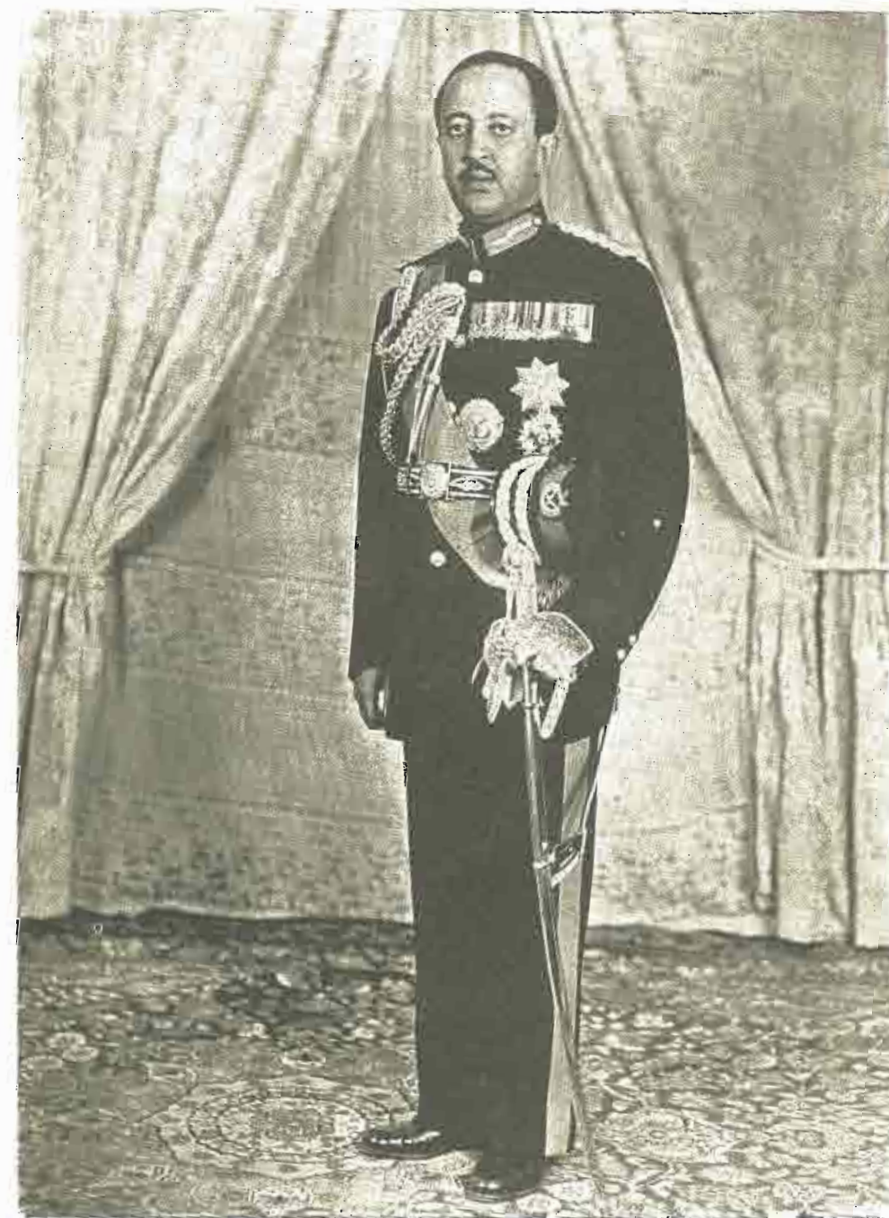
ልዑል ፡ መርድ ፡ አዝማች ፡ አስፋ ፡ ወሰን ፡ የኢትዮጵያ ፡ ንጉሠ ፡ ነገሥት ፡ መንግሥት ፡ አልጋ ፡ ወራሽ ።